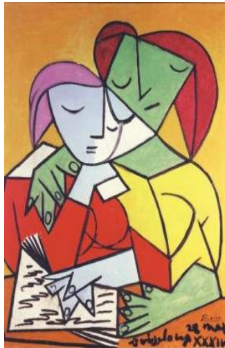
Pablo Picasso „Zwei lesende Mädchen“