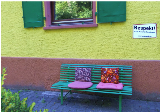
Pelagia Richter, „Lebensraum“, Foto bearb.

Innenleben und Außenräume impliziert ein Wechselspiel aus Nähe und Distanz. In unserem Fall würde eine Interieurdarstellung, die das Innenleben eines Raumes zeigt, für Nähe stehen und als Gegensatz dazu stünde dann z.B. eine Stadtsilhouette, aber auch einzelne Häuser, Straßen und Plätze usw.